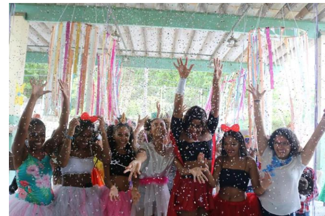
Fig.6- Festividade Carnaval- 28/02/2019