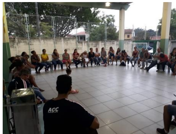
Fig.2- Reunião de pais/responsáveis- 15/02/2019