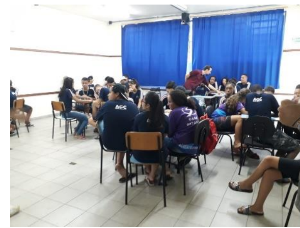
Fig. 3- Palestra dinamizada para FMT- 20/02/2019