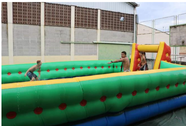
Fig.5- Festividade Carnaval- 28/02/2019