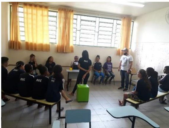
Fig. 4- Tribunal sobre a cultura do Carnaval- 26/02/2019